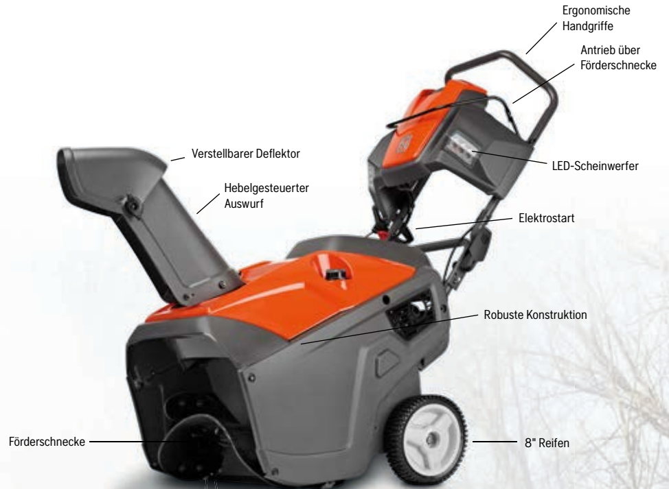
Husqvarna ST 151 ■ Husqvarna/LCT Motor, 208 cm 3 ■ Arbeitsbreite 53 cm

Einfach zu starten, gut zu manövrieren und kompakt zum Verstauen. LED Scheinwerfer verbessern die Arbeitsbedingungen zu jeder Tages- und Nachtzeit. Mit Elektrostart.